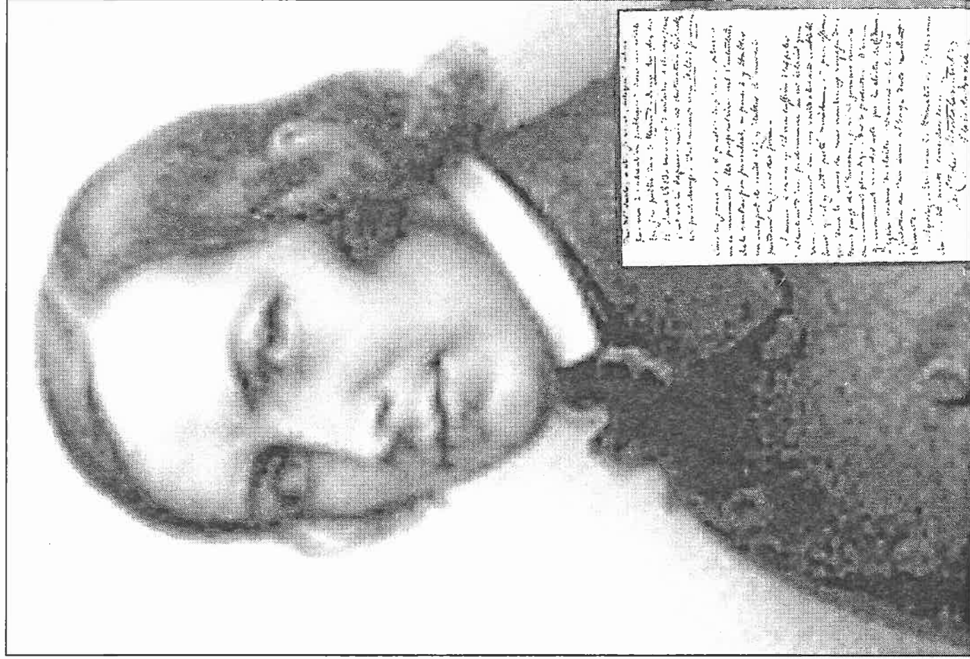
Charles Forbes, comte de Montalembert (1810-1870), visita le cloître en 1833. Il écrit son enthousiasme au ministre de l'intérieur, le 16 janvier 1838. Il s'indigne : le cloître a été transformé en étable à porceaux. Le futur auteur des Moines d'Occident a alors vingt-huit ans. Il est pair de France.