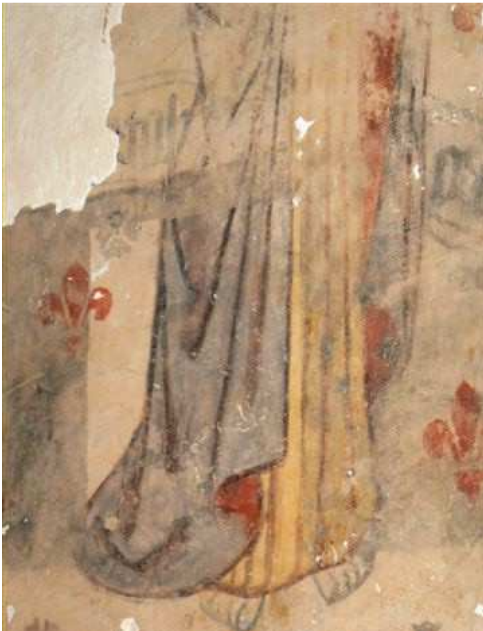
Fresques de l'église de Salles

En marge du colloque vous pourrez également visiter l'exposition photos anciennes ,organisée par le foyer rural à la mairie du village.