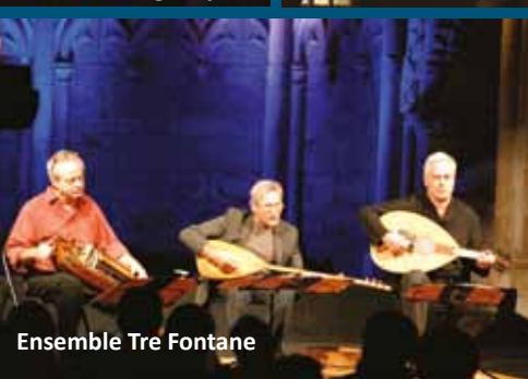
Ensemble Tre Fontane